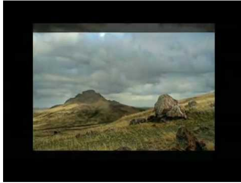
Video 6: YouTube; “Qazaq Sıbzıgı” - İlyas ÖZEN