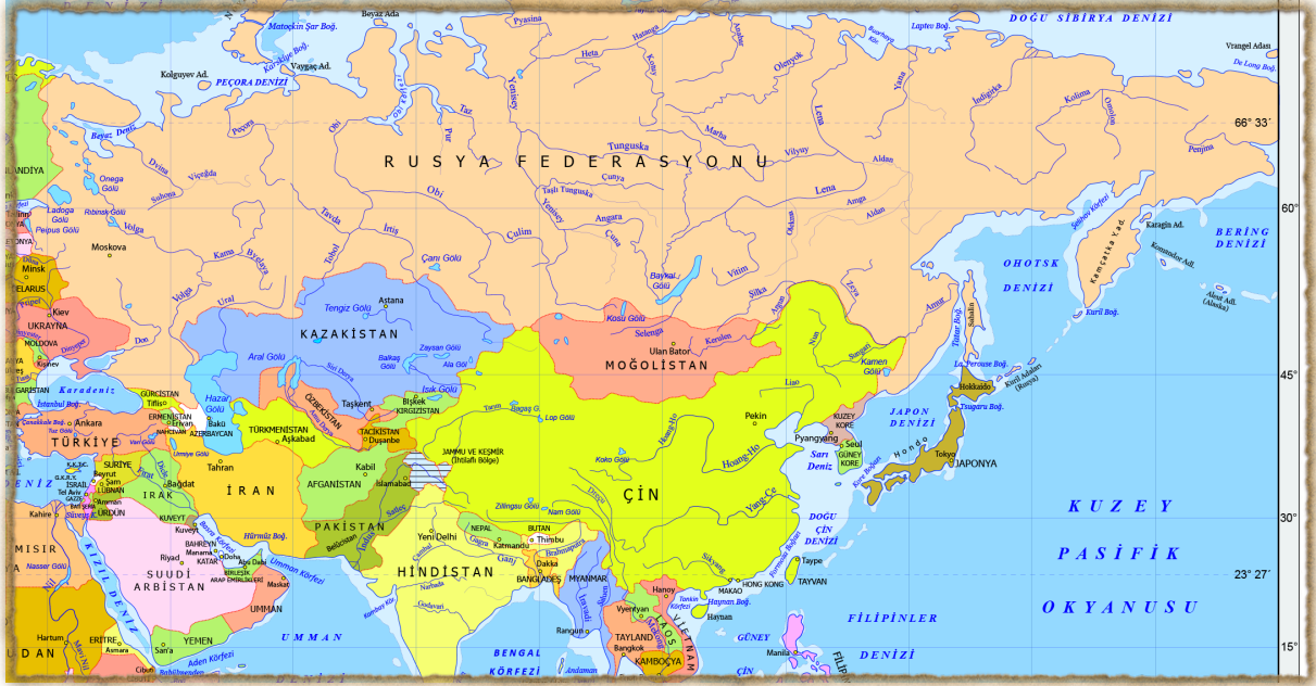
Şekil 5: İç Asya; Sayılan dört büyük arazinin ortasında kalan bölgedir.

Kültürlerarası yaşanan etkileşimler özü yok etmemekle birlikte, kimi öğeleri değiştirebilmekte ve çeşitlendirebilmektedir. “Öğelerin geçişi yüzünden de değişik toplumlarda birbirine benzeyen kültürel özellikler” 7 görülebilmektedir.