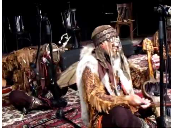
Video 2: YouTube; “Hüzzam Şaman Ayini - Turan Ensemble” - Kırkambar

Bakşılar 10 “kopuzlarını seslerine, tellere vurduğu monoton seslerle eşlik veriyorlardı. Yani musiki aleti, melodiye değil; hafifçe ritme eşlik ediyordu. Destanlarda veya dualardaki ana ses de, insan sesi idi.”