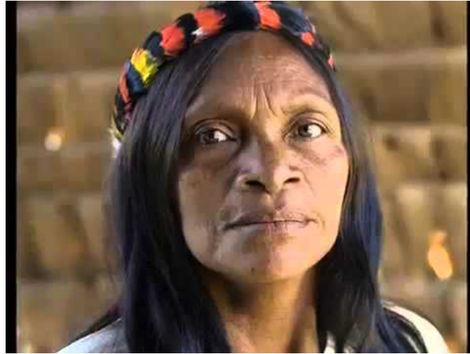
Video 1: YouTube; “Türk Şaman Müziği” - Sömürge Oyunları

Ana temeli insan sesine bağlı müziğin, sözleri doğaçlama olup, ritim ve melodi önem taşımaktaydı.