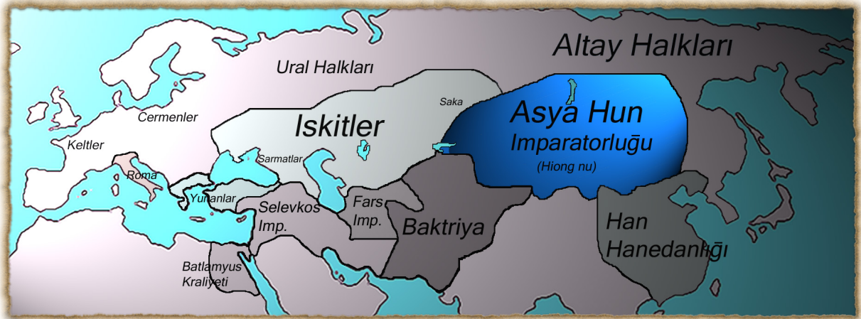
Şekil 6: Altay halkları haritası