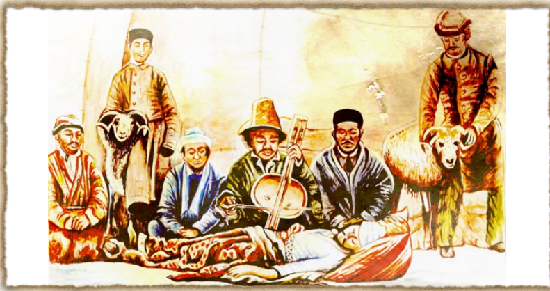
Şekil 9: Iklığ