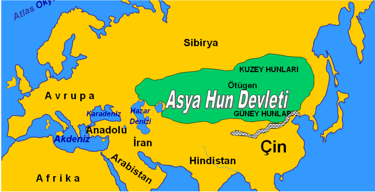
Şekil 7: Asya Hun Devleti haritası