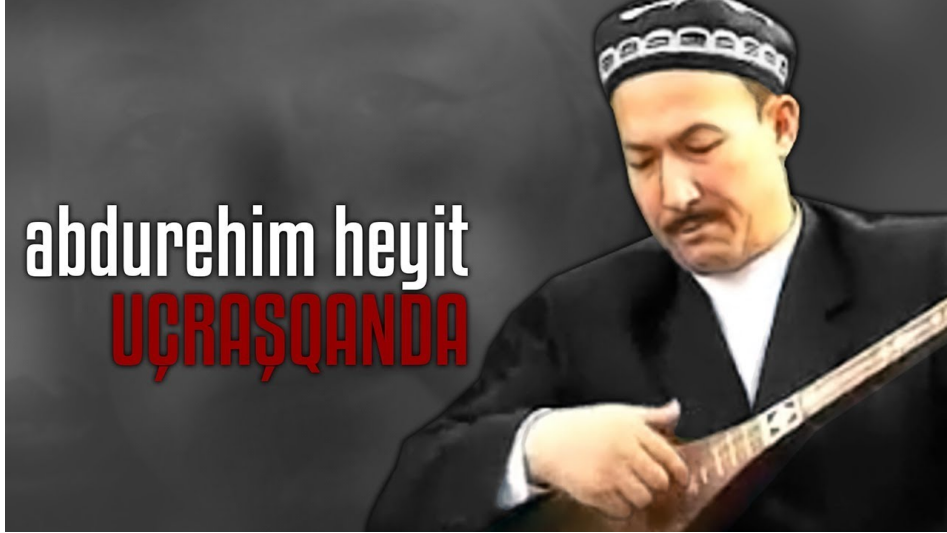
Video 7: YouTube; “Abdurehim Heyit - Karřılařınca” - Emintzsche