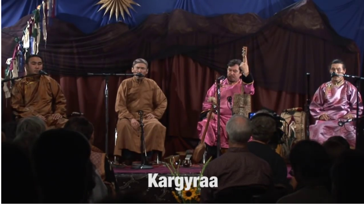
Video 4: YouTube; “Huun-Huur-Tu - Live Berkely” - Jaro Medien GmbH - Bremen

Bağı'lı müzik (sihirli müzik) olarak tabir edilen Şaman müziğinde, ezgiye sihri (bağıy) yapan Şaman'dan başka kimsenin anlayamayacağı bir takım sözler yer alır. Az perdeli, basit kurgulu, ritimsel tekrarlı, tiz ve pest tonalite öğelerinden oluşan özelliklere sahipti. “Bağılı ibarenin tekrarı (ritim) ve kalınlı-ince (pest-tiz) sesler (tonalite) bir araya gelmedikçe bağının etkisi olamamakta ve amaca ulaşılammaktaydı.” 12