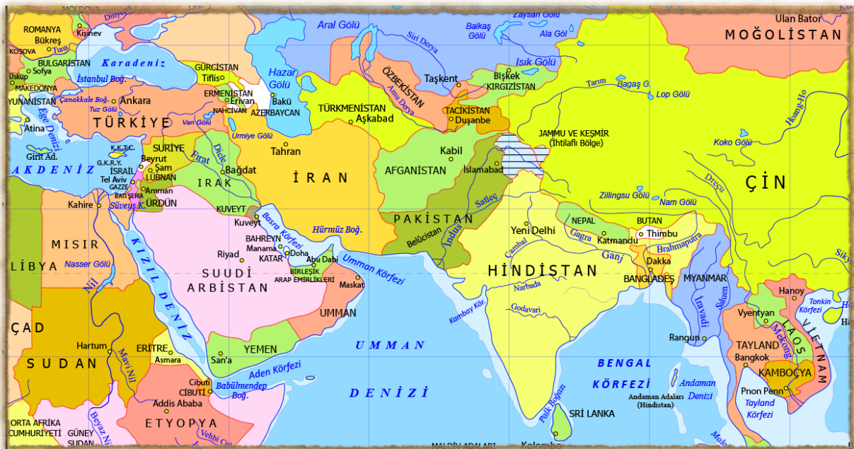
Şekil 4: Ön Asya; İran, Afganistan, Ermenistan, Arabistan, Suriye, Irak (Mezopotamya).