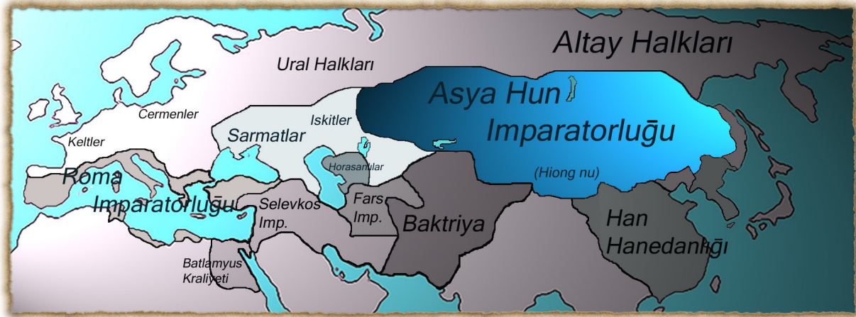
Şekil 6: Altay halkları ve Asya Hun İmparatorluğu haritası