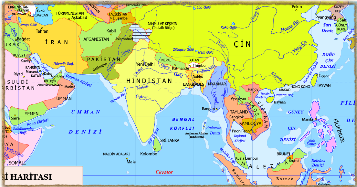
Şekil 3: Güney Asya; Hindistan, Çin Hindi, Doğu Hint Adaları (Malaya).