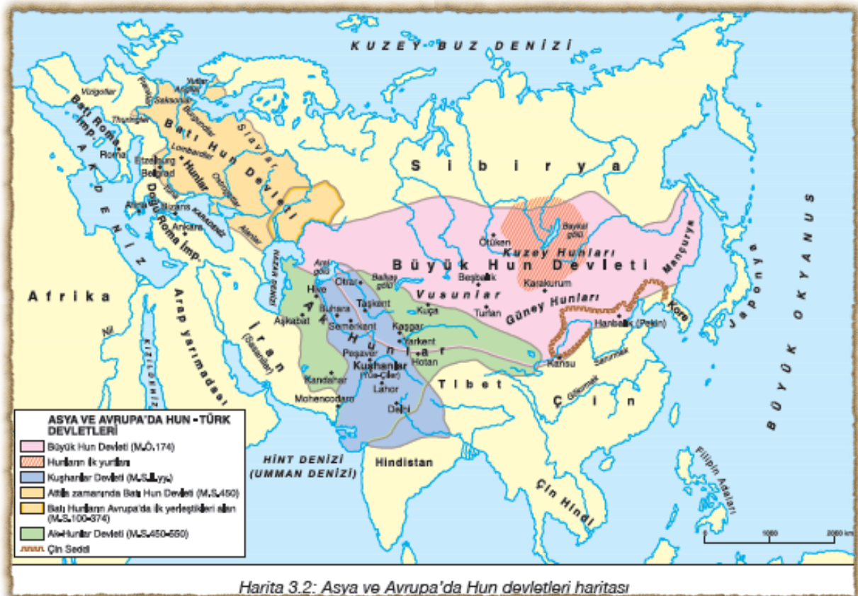
Şekil 1: Kuzey Asya; Yaklaşık olarak bugünkü Sibiryası sınırlarını kapsamaktadır.

Coğrafi konuma göre toplumların birbirlerinden ayırt edici özellikler taşıması, beraberinde farklı niteliklere sahip olmalarını getirmiştir. Asya coğrafyası uygarlıkları arasında, tarihsel süreçte yaşanan göçler ve dolayısıyla kültürlerarası geçişler, etkileşimler; birbirlerinin kültür, tarih ve sosyal / ekonomik yapılarının belirleyicisi olmuştur. Bu özellikler çerçevesinde bakıldığında, Asya'yı beş büyük coğrafya ve medeniyet birliğine ayırmak mümkündür: